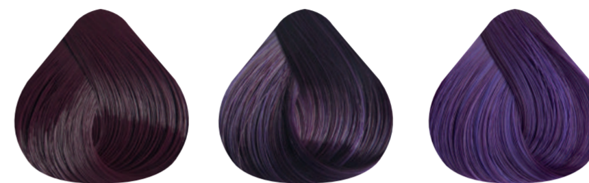
5-68 BORGONA 7-88 RUBIO MEDIO VIOLETA PROFUNDO 8-88 RUBIO CLARO VIOLETA PROFUNDO