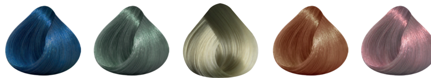
901 AGUA 902 ALOE 903 CHAMPAGNE 904 COBRE NACARADO 906 ROSA