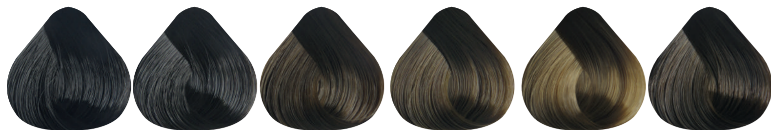
1-0 NEGRO NATURAL 3-0 CASTAÑO OSCURO NATURAL 5-0 CASTAÑO CLARO NATURAL 7-0 RUBIO MEDIO NATURAL 8-0 RUBIO CLARO NATURAL 7-00 RUBIO MEDIO NATURAL PROFUNDO