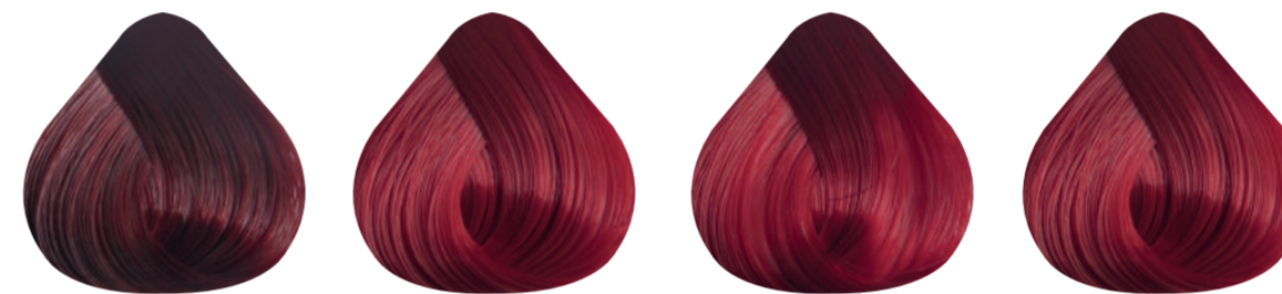
5-60 CASTAÑO CLARO ROJO 8-60 RUBIO CLARO ROJO 7-6 ROJO SHANGAI 7-68 ROJO VIOLINO