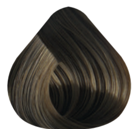
7-3 RUBIO MEDIO DORADO