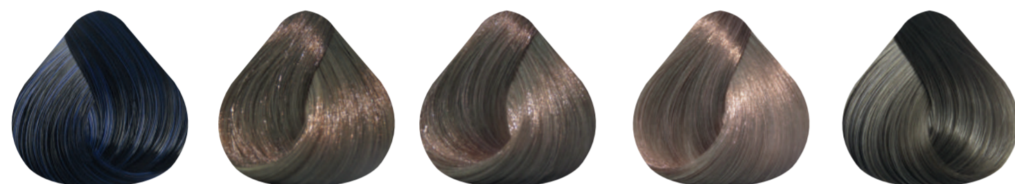
2-1 NEGRO AZUL 7-1 RUBIO MEDIO CENIZO 8-1 RUBIO CLARO CENIZO 9-1 RUBIO MUY CLARO CENIZO 8-11 RUBIO CLARO CENIZO PROFUNDO