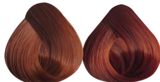
6-44 RUBIO OSCURO COBRE 7-44 RUBIO MEDIO COBRE