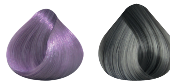
908 IRISADO 909 PLATINO