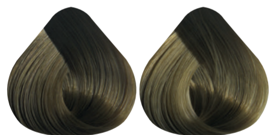
7-2 RUBIO MEDIO MATE 8-2 RUBIO CLARO MATE