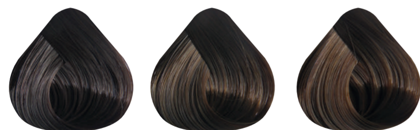
5-53 CHOCOLATE OSCURO 6-53 CHOCOLATE 7-53 CHOCOLATE CLARO